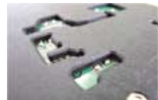
裏面テーパー加工例

一般特性 耐熱性 :300℃ 5時間加熱後異常なし 曲げ強さ :350Mpa 以上 面抵抗 :10E+6~10E+9